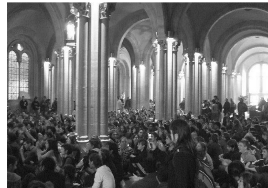
Multitudinària assemblea d'estudiants decideix ocupar indefinidament el rectorat de la UB

Les vacances de nadal i els exàmens han paralytitzat, com tots els anys, la vida de les assemblees de facultat. Tot i això la tancada del rectorat de la UB ha aconlhit més d'un centenar d'activistes de diferents universitats que han volgut seguir construint el moviment durant un període històricament desmobilitzador. Aquest fet, sense massa precedents, ens pot donar una idea de la salut del movi-